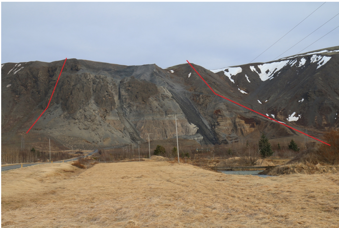
Mynd 2. Eystri- og vestari mörk efnistökusvæðisins (Byggt á svörum framkvæmdaraðila).

Fram kemur að áhrifa á landslag og ásýnd Ingólfsfalls gæti nú þegar þar sem efnistaka hefur verið á svæðinu síðustu áratugi en áframhaldandi efnistaka mun hafa í för með sér meiri röskun á landslagi. Fjallshlíðin og vinnslusvæðið undir henni er nú þegar að mestu raskað og ekki stendur til að raska meira af fjallshlíðinni, hvorki til austurs né vesturs (sbr. afmörkun á mynd 2). Uppi á Ingólfsfjalli, ofan núverandi efnistökusvæðis, er óraskað svæði sem fyrirhugað er að raska. Efnistökusvæðið mun ná lengra inn á fjallið og verður svo unnið niður. Rasksvæði sem sést frá láglandi, m.a. frá Suðurlandsvegi sem er í um 250 m fjarlægð frá námunni, mun því ekki stækka en með tímanum mun fjallsbrún raskaða svæðisins færast norðar og geil myndast í hlíðina þar sem efnistakan vinnur sig niður. Ásýnd Ingólfsfjalls mun því breytast á því svæði sem þegar hefur verið raskað. Náttúrulegar fjallsbrúnir og hlíðar Ingólfsfjalls beggja vegna efnistökusvæðisins munu haldast óbreyttar.