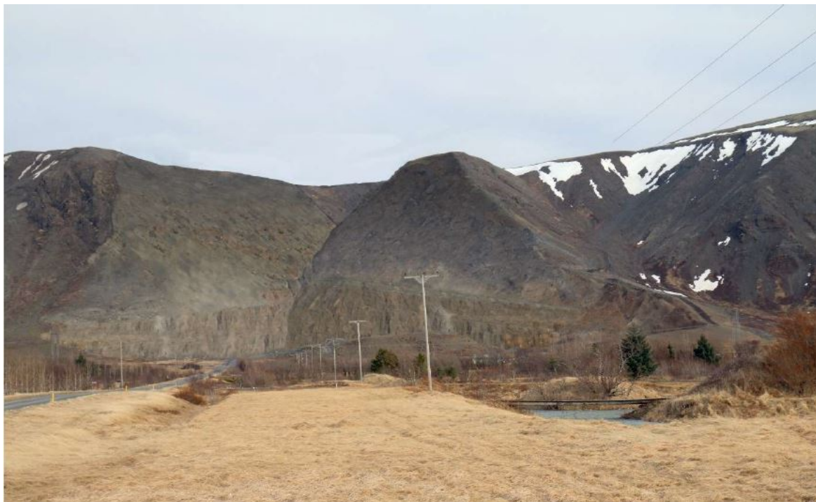
Mynd 1. Þórustaðanáma séð frá heimreið að Þórustöðum eftir að efnistöku lýkur. Ætlunin er að hallinn á hlíðinni verði sambærilegur og í Djúpadal sem er til hægri á myndinni (Byggt á matsskýrslu).